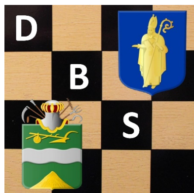
Damclub Baarn Soest

Animaties op het demonstratiebord: Jan van de Veen, Nijkerk